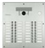
308015 Pulsantiera Linea 300 video. Tecnologia ...