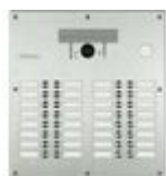
308005 Pulsantiera Linea 300 video. Tecnologia ...