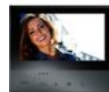
344643 Videocitofono connesso 2 fili / Wi-Fi vi...