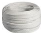
336905 Cavo specifico per BUS/SCS non schermato...