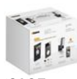
363927 Kit vivavoce monofamiliare con videocito...