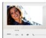
344642 Videocitofono connesso 2 fili / Wi-Fi vi...