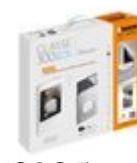
363925 Kit vivavoce monofamiliare con videocito...