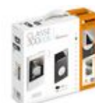
363915 kit vivavoce monofamiliare con: videocit...