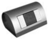
348402 Programmatore da tavolo per badge RFID a...