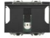
H4649 Tasca portabadge in BUS- SCS per l'alimen...