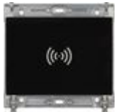
345520 Modulo smart access RFID/bluetooth per a...