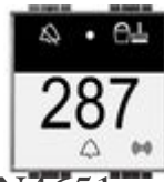
LN4651 Serie Livinglight - lettore di badge in ...