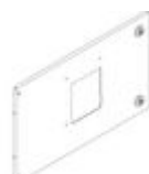
9531/ETN Pannello per interruttori M160-250 e M4 ...