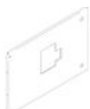
9531/02ECM Pannello per interruttori M160-250 estra...