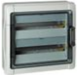
F107N18H Contenitore multifunzione orizzontale pe...