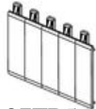
F107FP5 Otturatori per centralini IDROBOARD (n 5...