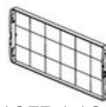
F107PA18 Piastra di fissaggio piena per per centr...