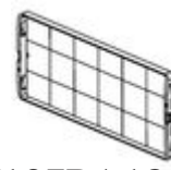
F107PA18 Piastra di fissaggio piena per per centr...