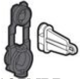
F107NPB Kit di piombatura per centralini IDROBOA...