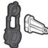
F107NPB Kit di piombatura per centralini IDROBOA...