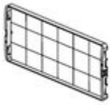
F107PA18 Piastra di fissaggio piena per per centr...