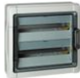
F107N18H Contenitore multifunzione orizzontale pe...