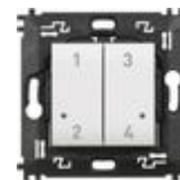
N4575CW Comando 4 scenari wireless dotato di pul...