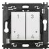
N4575CW Comando 4 scenari wireless dotato di pul...