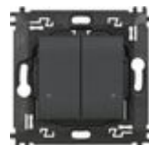
L4003DCW Comando doppio luci wireless dotato di d...