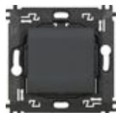
L4003CW Comando luci wireless. Permette il contr...