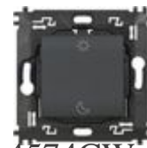
L4574CW Comando scenario Notte&Giorno wireless. ...