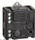
3584C Relè luci connesso. Permette di controll...