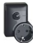
4141PC Presa plug&play connessa standard German...