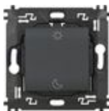
L4574CW Comando scenario Notte&Giorno wireless. ...