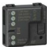
3584C Relè luci connesso. Permette di controll...