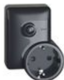
4141PC Presina plug&play connessa standard German...