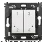
N4575CW Comando 4 scenari wireless dotato di pul...