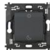
L4574CW Comando scenario Notte&Giorno wireless. ...