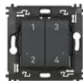
L4575CW Comando 4 scenari wireless dotato di pul...