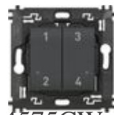
L4575CW Comando 4 scenari wireless dotato di pul...