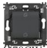
L4570CW Comando scenario Entra&Esci wireless. Di...