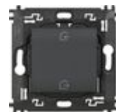
L4570CW Comando scenario Entra&Esci wireless. Di...