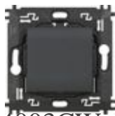
L4003CW Comando luci wireless. Permette il contr...