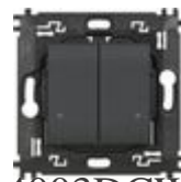
L4003DCW Comando doppio luci wireless dotato di d...