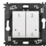
N4575CW Comando 4 scenari wireless dotato di pul...