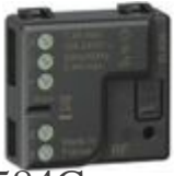
3584C Relè luci connesso. Permette di controll...