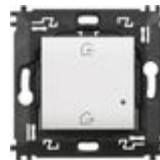
N4570CW Comando scenario Entra&Esci wireless. Di...