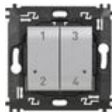
NT4575CW Comando 4 scenari wireless dotato di pul...