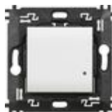
N4003CW Comando luci wireless. Permette il contr...