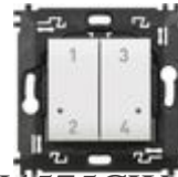
N4575CW Comando 4 scenari wireless dotato di pul...