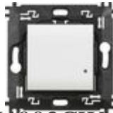
N4003CW Comando luci wireless. Permette il contr...