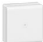
030316 minicanali - scatole di derivazione 75 x...