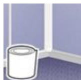
030418 minicanali 20 x 10mm - giunzione basi da...