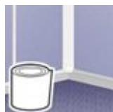
030418 minicanali 20 x 10mm - giunzione basi da...