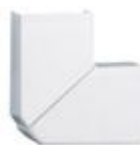
033328 minicanali 40 x 16mm - angolo piano vari...