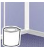
030418 minicanali 20 x 10mm - giunzione basi da...