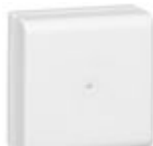
030326 minicanali - scatole di derivazione 110...