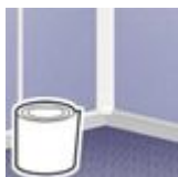
030418 minicanali 20 x 10mm - giunzione basi da...