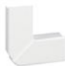
030283 minicanali 40 x 20mm - angolo piano vari...