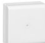
030326 minicanali - scatole di derivazione 110...