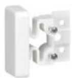
031207 minicanali 32 x 16mm - terminale destro/...