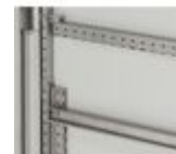
047721 Traversini per porte (larghezza 1000mm) ...