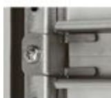
047718 Squadretta di fissaggio su porta da mont...