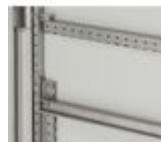
047719 Traversini per porte (larghezza 600mm) d...