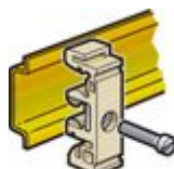
036478 Griffa per vite diametro 4 mm per guide ...