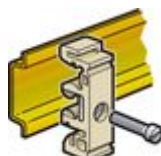
036479 Griffa per vite diametro 6 mm per guide ...